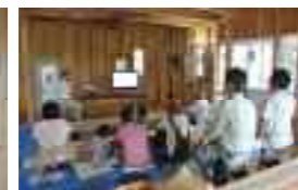
家が頑丈になる秘密

サイケンの家は、冬あったか・夏涼しい住まいなので見学会中も居心地良いと言ってくれます♪♪