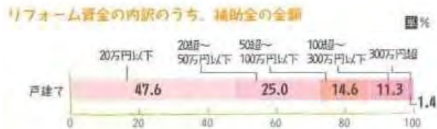
住宅リフォーム推進協議会「平成24年度 住宅リフォーム実例調査」より