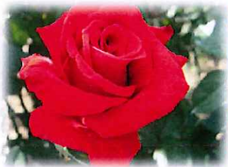
バラ 赤:愛・情熱*白:純潔 黄:嫉妬*ピンク:恋の誓い