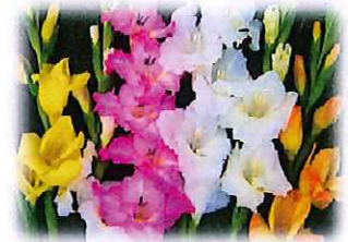
グラジオラス 密会、用心、堅固