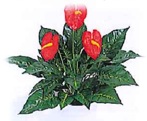
アンズリウム 煩惱・情熱