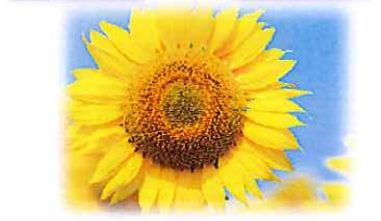
ヒマワリ 愛慕・高貴・光輝