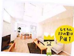
ボクの秘密を大公開! 快適なお家には「ワケ」がある!

パンイチくんとは... パンツ一丁で過ごせる快適な家で、家族みんながパンイチで過ごすことを夢見ているFPの家オリジナルのキャラクター!