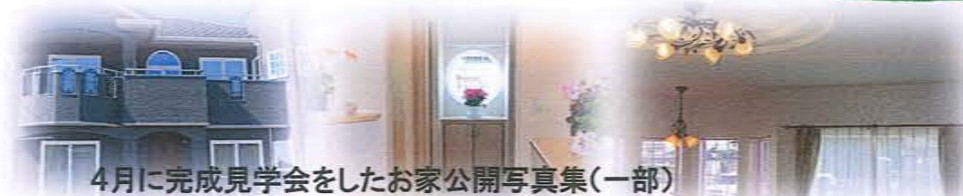
4月に完成見学会をしたお家公開写真集(一部)