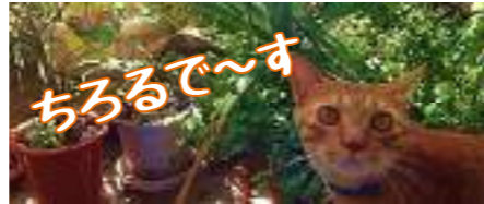
サイケンの看板猫

師走の時節柄、ご多忙のことと存じますがくれぐれもご自愛のうえ、晴れやかな新年をお迎えになられますよう心よりお祈り申し上げます。 また、来年もなにとぞ変わらぬご厚誼のほど宜しくお願い申し上げます。